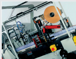
Separación y enfajado