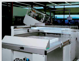
Entrada de los paquetes en tiras

El Atlas 1200 es la solución ideal para la producción de etiquetas cortadas de forma total o parcialmente automatizada con o sin enfajado maxipack.