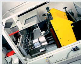
Stanzen im Gegendruck